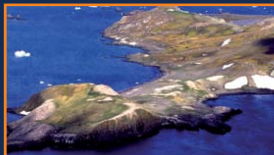
Aire de débarquement du côté oriental de l'île Barrientos