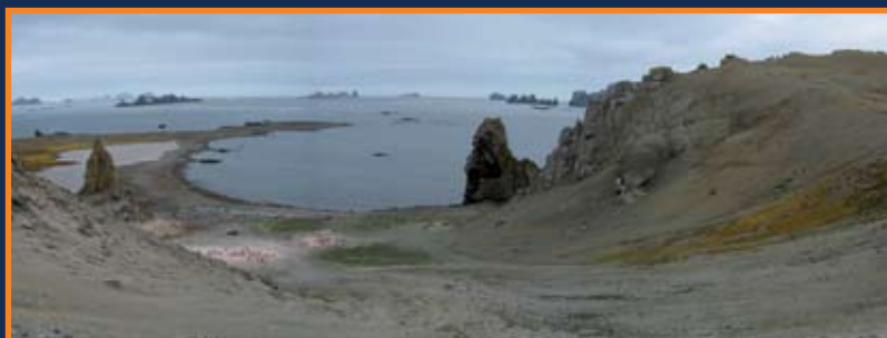
Aire de débarquement du côté occidental de l'île Barrientos

Restez à l'écart des falaises et des parois verticales qui sont en effet sujettes à des chutes de roches et à des éboulements.