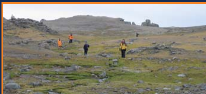
Marchez uniquement à travers l'aire fermée B si vous pouvez clairement reconnaître le parcours